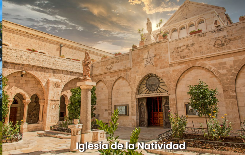
Iglesia de la Natividad

Hoy: Visitamos el Monte de los Olivos y el Pater Noster, donde Jesús enseñó el Padrenuestro a sus discípulos. Caminamos la ruta del Domingo de Ramos y hacemos una parada en Dominus Flevit, donde Jesús lloró por Jerusalén. En el Huerto de Getsemaní, veremos la Roca de la Agonía, donde Jesús oró antes de ser arrestado. Celebraremos la Misa en la Iglesia de Todas las Naciones. También visitaremos la Capilla de la Ascensión y el