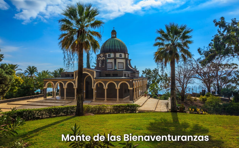
Monte de las Bienaventuranzas