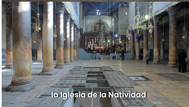
la Iglesia de la Natividad